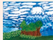
【絵画の部 優秀作品】

障がいのある・なしに関わらず地域のつながりを守り、互いの理解を深めるため、作品を通じた交流として作品展示と、3年ぶりに人と人のふれあいを通じた交流としてワークショップを開催しました。優秀作品は応募総数137点の中から選ばれました。