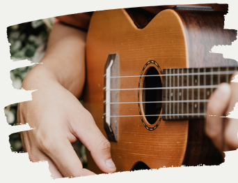
活動ステージ発表