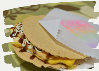
おいしい玉せんや お弁当販売