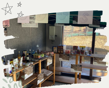
フードロスをなくそう