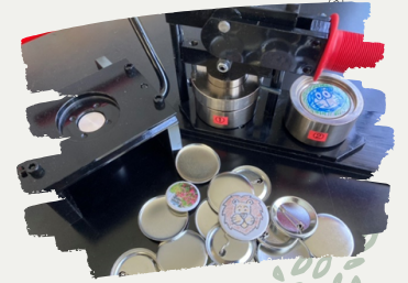
オリジナル 缶バッチづくり