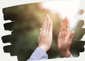
挑戦！MIYOSHIレコード！ 100人ハイタッチ