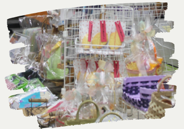
市内社会福祉法人の おみやげ販売