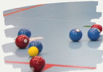
車いすに乗って ポッチャに挑戦